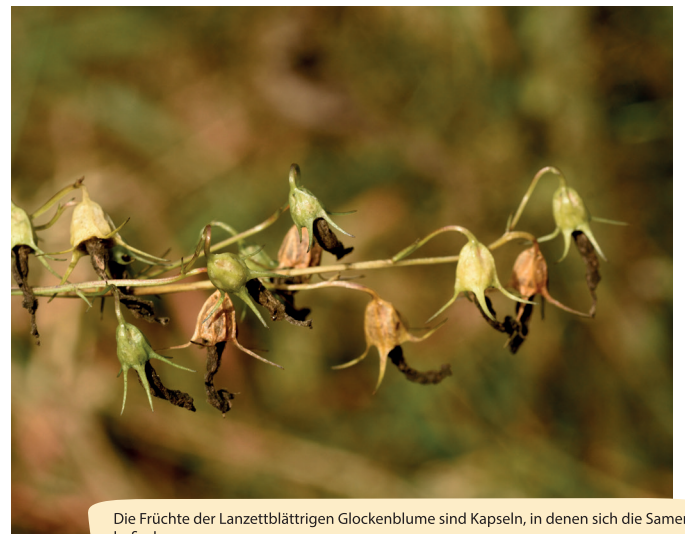
Die Früchte der Lanzettblättrigen Glockenblume sind Kapseln, in denen sich die Samen befinden.