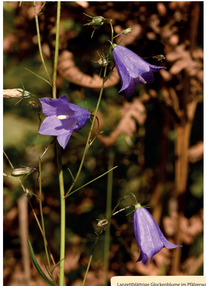
Lanzettblättrige Glockenblume im Pfälzerwald.

In der Blüte geht es aber auch nach der männlichen Phase spannend weiter, denn jetzt bilden sich die Haare am Griffel zurück. Noch bevor die Narbe am oberen Ende des Griffels fruchtbar wird, ist die Blüte so gut wie frei von eigenem Pollen. Denn was nicht von den Bienen geerntet wurde fällt spätestens jetzt ab. Nun kann der Pollen, der von Wildbienen oder anderen Insekten aus einer benachbarten Blüte mitgebracht wurde, auf die Narbe gelangen und die Blüte wird fremdbestäubt. Da auch in der weiblichen Phase immer noch viel Nektar produziert wird, ist der Blütenbesuch